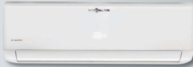
Vitoclima 200-S/HE iç ünite, PRO serisi