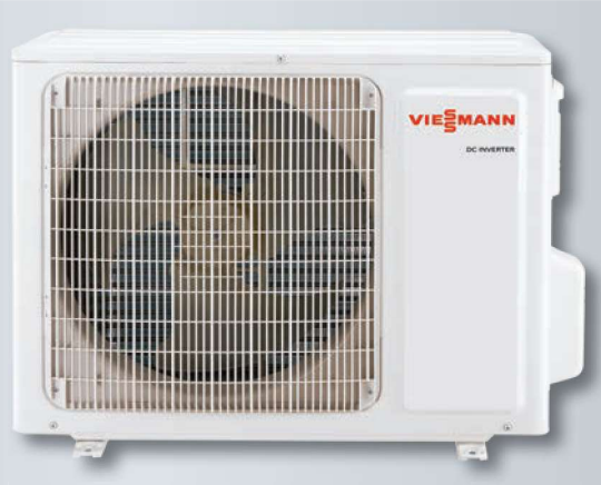
Vitoclima 200-S/HE dış ünite, PRO serisi